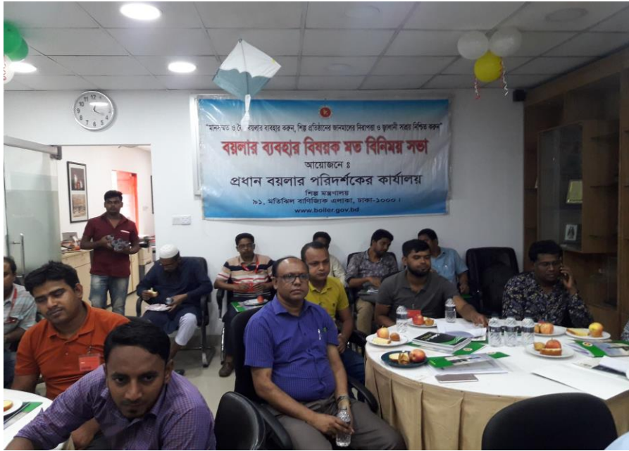
সচেতনতামূলক সভায় অংশগ্রহনকারীবৃন্দ