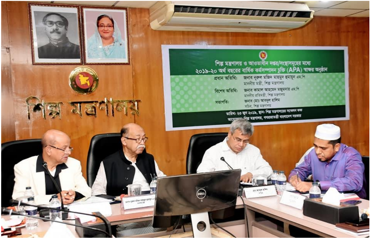
২০১৯-২০ অর্থ বছরের APA স্বাক্ষর অনুষ্ঠান, তারিখ: ১৭/০৬/২০১৯

১৭/০৬/২০১৯ তারিখে শিল্প মন্ত্রণালয়ের সাথে প্রধান বয়লার পরিদর্শকের কার্যালয়ের ২০১৯-২০ অর্থ বছরের APA স্বাক্ষর অনুষ্ঠান অনুষ্ঠিত হয়।