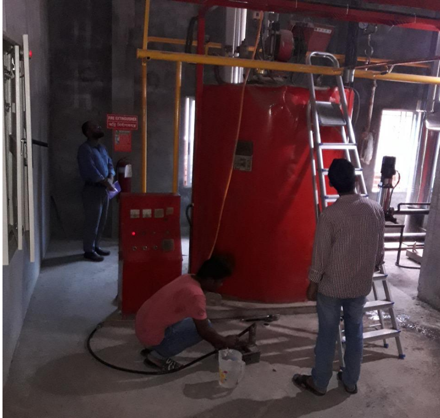
নবায়নের জন্য বয়লার পরিদর্শন (জলীয় পরীক্ষা)