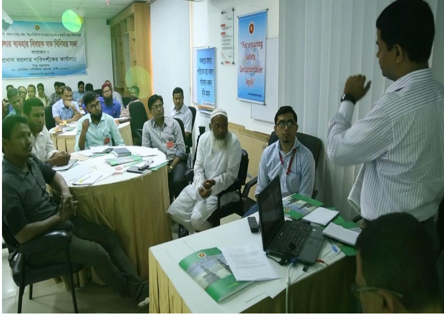
সচেতনতামূলক সভায় পরামর্শ দিচ্ছেন উপপ্রধান বয়লার পরিদর্শক

গত ১৬/০৪/২০১৯ খ্রি. তারিখে বাটা সু কোম্পানী লিঃ এর সম্মেলন কক্ষে স্টেক হোল্ডারদের সাথে বয়লার ব্যবহার বিষয়ক সচেতনতামূলক সভা অনুষ্ঠিত হয়েছে। উক্ত সভায় সভাপতিত্ব করেন উপ-প্রধান বয়লার পরিদর্শক, ঢাকা। উপপ্রধান বয়লার পরিদর্শক স্টেকহোল্ডারগণকে বয়লার ব্যবহার বিষয়ে পরামর্শ প্রদান করেন।