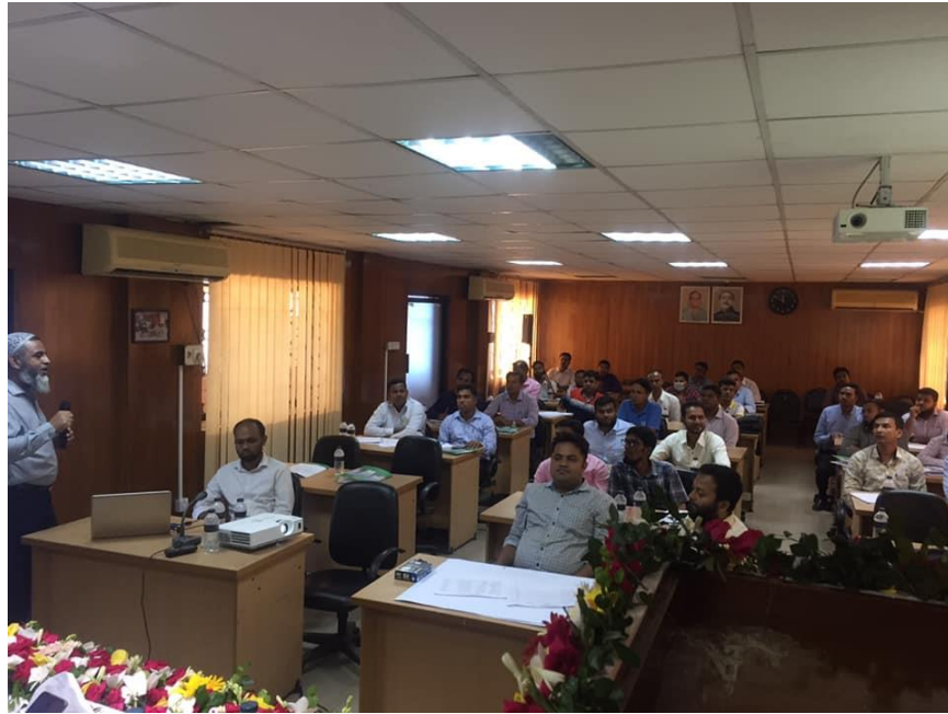
বয়লার বিষয়ক প্রশিক্ষণ কর্মশালার অংশগ্রহনকারীবৃন্দ।