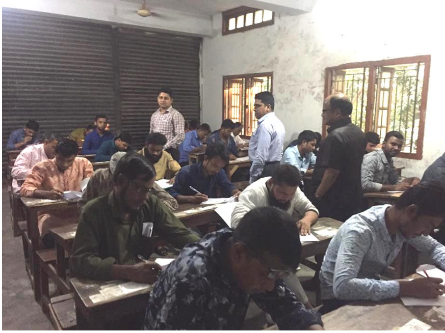
লিখিত পরীক্ষা গ্রহন

৬। বয়লার পরিচালক প্রার্থীদের পরীক্ষা গ্রহন।