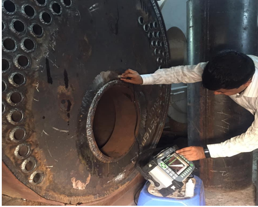
স্থানীয়ভাবে বয়লার তৈরীকালীন সময়ে বয়লার পরিদর্শন