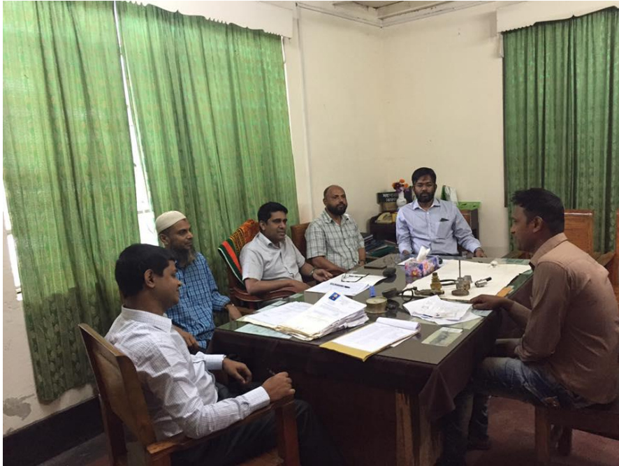
মৌখিক ও ব্যবহারিক পরীক্ষা গ্রহন