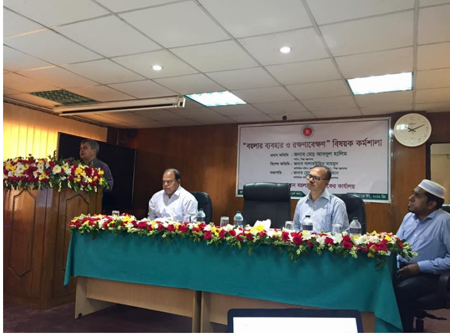
বয়লার বিষয়ক প্রশিক্ষণ কর্মশালায় প্রধান অতিথি সচিব, শিল্প মন্ত্রণালয় বক্তব্য প্রদান করছেন।

গত ১৯/০৬/২০১৯ খ্রি. তারিখে প্রথম শ্রেণির বয়লার পরিচারকদের নিয়ে বয়লার বিষয়ক প্রশিক্ষণ কর্মশালার আয়োজন করা হয়। প্রধান অতিথি হিসেবে উপস্থিত ছিলেন সচিব, শিল্প মন্ত্রণালয়। উক্ত অনুষ্ঠানে সচিব, শিল্প মন্ত্রণালয় শিল্পের দুর্ঘটনা রোধ করতে নিরাপদ বয়লার চালনার বিষয়ে নির্দেশনা প্রদান করেন।